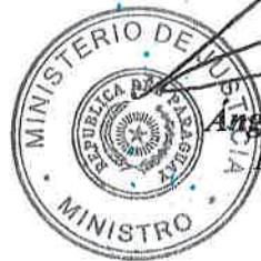
Angel Barchini Ministro

Sin otro particular, hago propicia la oportunidad para expresarle la seguridad de mi más alta y distinguida consideración.-