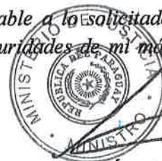
Angel Barchini Ministro

En la espera de un despacho favorable a lo solicitado, hago propicia la oportunidad para expresarle a Vuestra Excelencia las seguridades de mi más alta y distinguida consideración.-