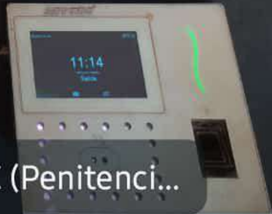
📍 Penitenciaría Regional de P.J.C (Penitenci...