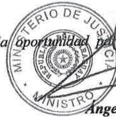
Angel Barchini Ministro

Sin otro particular, hago propicia la oportunidad para expresarle las seguridades de mi más alta y distinguida consideración.-