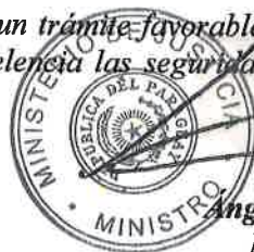
Angel Barchini Ministro

Sin otro particular, y esperando un trámite favorable a lo solicitado hago propicia la oportunidad para expresarle a Vuestra Excelencia las seguridades de mi más alta y distinguida consideración. -