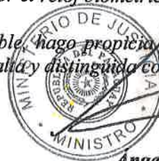
Angel Barchini Ministro

En espera de una respuesta favorable, hago propicia la oportunidad para expresar a Vuestra Excelencia las seguridades de mi más alta y distinguida consideración.