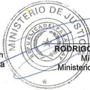
RODRIGO NICORA V. Ministro Ministerio de Justicia