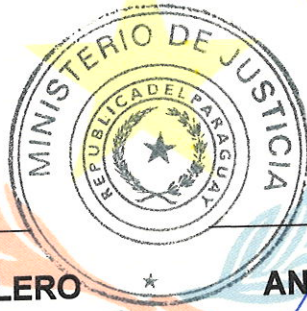
ANGEL BARCHINI Ministro Ministerio de Justicia